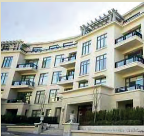
El condominio se ubica en la calle Water's Edge Crescent, en West Vancouver, cerca de Park Royal.