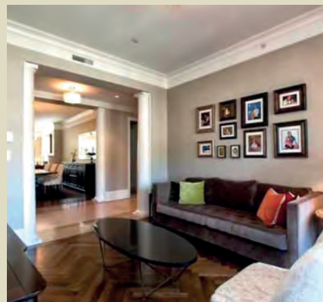
El departamento cuenta con una estancia familiar y espacio para oficina.