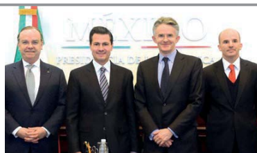
EL MANDATARIO (segundo de izq. a der.), ayer, con directivos de HSBC y el secretario de Hacienda.

Directivos de la institución británica refrendan compromiso con México; el Presidente destaca crecimiento, generación de empleos y atracción de inversiones en 2017 pese a factores externos. pág. 10