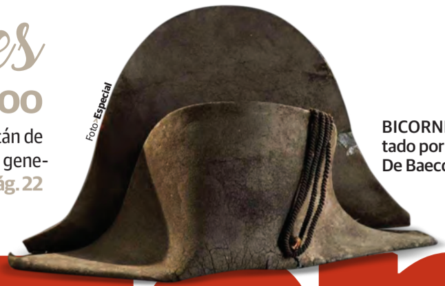
BICORNIO subastado por la casa De Baecque.

»La pieza de fieltro negro fue recogida después de la derrota en el campo de batalla en 1815 por un capitán de dragones holandeses; el bicornio, uno de los 19 que han sido identificados del emperador francés, pasó de generación en generación; en 1986 fue vendido a un coleccionista galo y sus herederos lo ponen en venta pág. 22