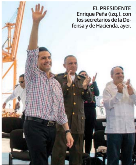
EL PRESIDENTE Enrique Peña (izq.), con los secretarios de la Defensa y de Hacienda, ayer.

» El mandatario emite declaratoria de Zonas Económicas Especiales para Oaxaca y Yucatán; con éstas suman cinco; garantiza cumplir en 2018 con el 97 por ciento de los 266 compromisos firmados pág. 12