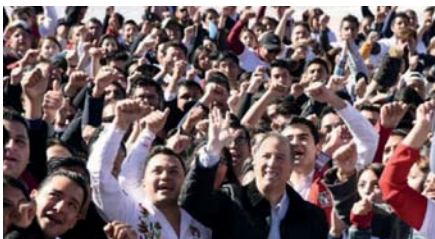
JOSÉ ANTONIO Meade, ayer, con militantes priistas en Hidalgo.

El precandidato del PRI asegura que en la vida de todos los niños y niñas que nazcan en México estarán presentes salud, vivienda, alimentación y educación pág. 7