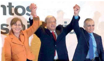
AMLO (centro) con Tatiana Clouthier y Alfonso Romo, ayer.

El precandidato de Morena presenta como su coordinadora de campaña a la expanista Tatiana Clouthier y a Alfonso Romo como enlace con empresarios, gobiernos y sociedad pág. 7