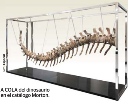
LA COLA del dinosaurio en el catálogo Morton.