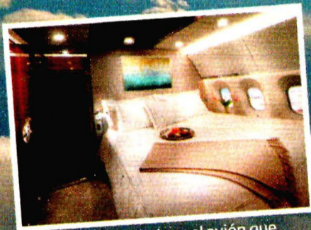
La suite que tiene el avión que se adquirió para uso del Jefe del Ejecutivo.