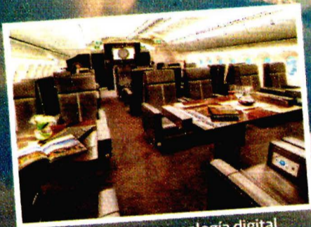
Asientos con tecnología digital e Internet de alta velocidad.