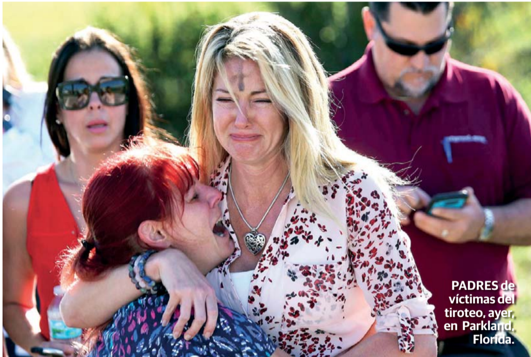
PADRES de víctimas del tiroteo, ayer, en Parkland, Florida.