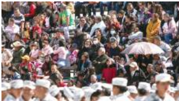
FAMILIARES en graduación de la Guardia Nacional, ayer.

• Gestiona Ebrard que cierre de frontera con EU no sea total; saturan cruces tras llamado de Trump a evitar viajes al extranjero y a los que están fuera a regresar pág. 5