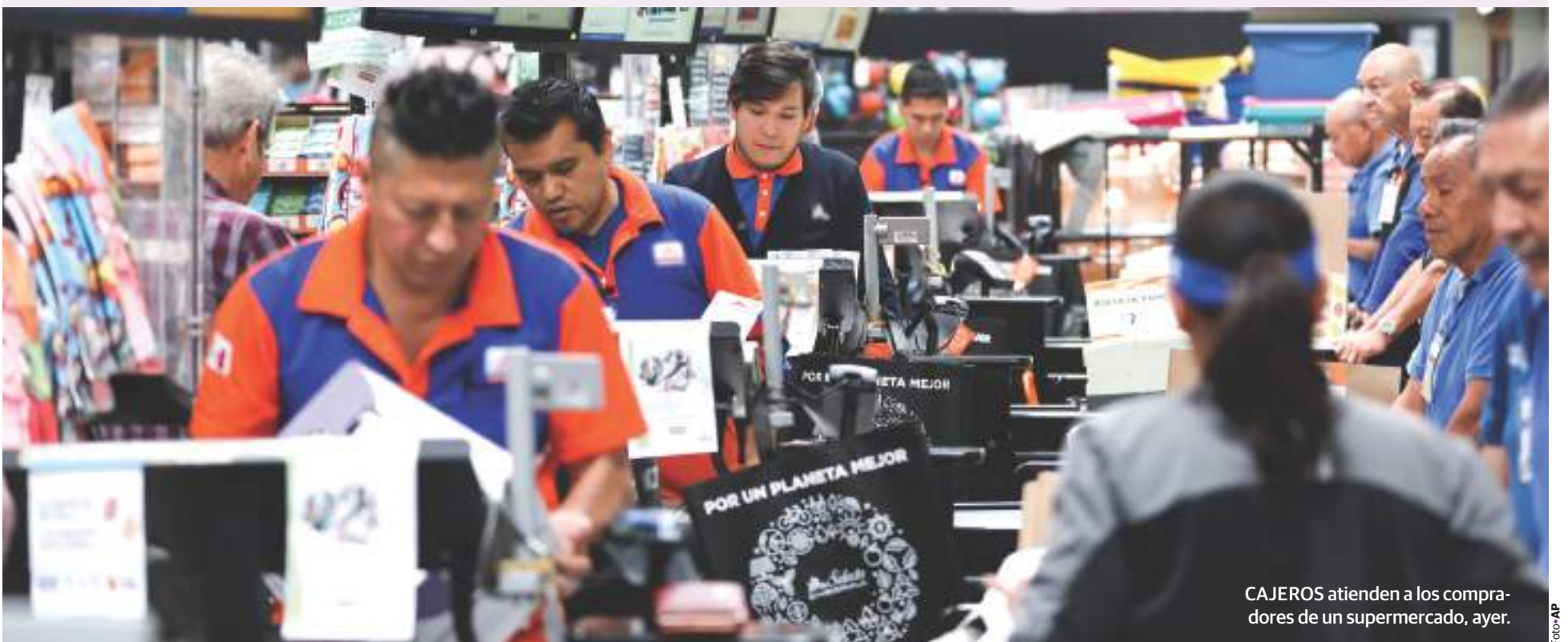
CAJEROS atienden a los compradores de un supermercado, ayer.