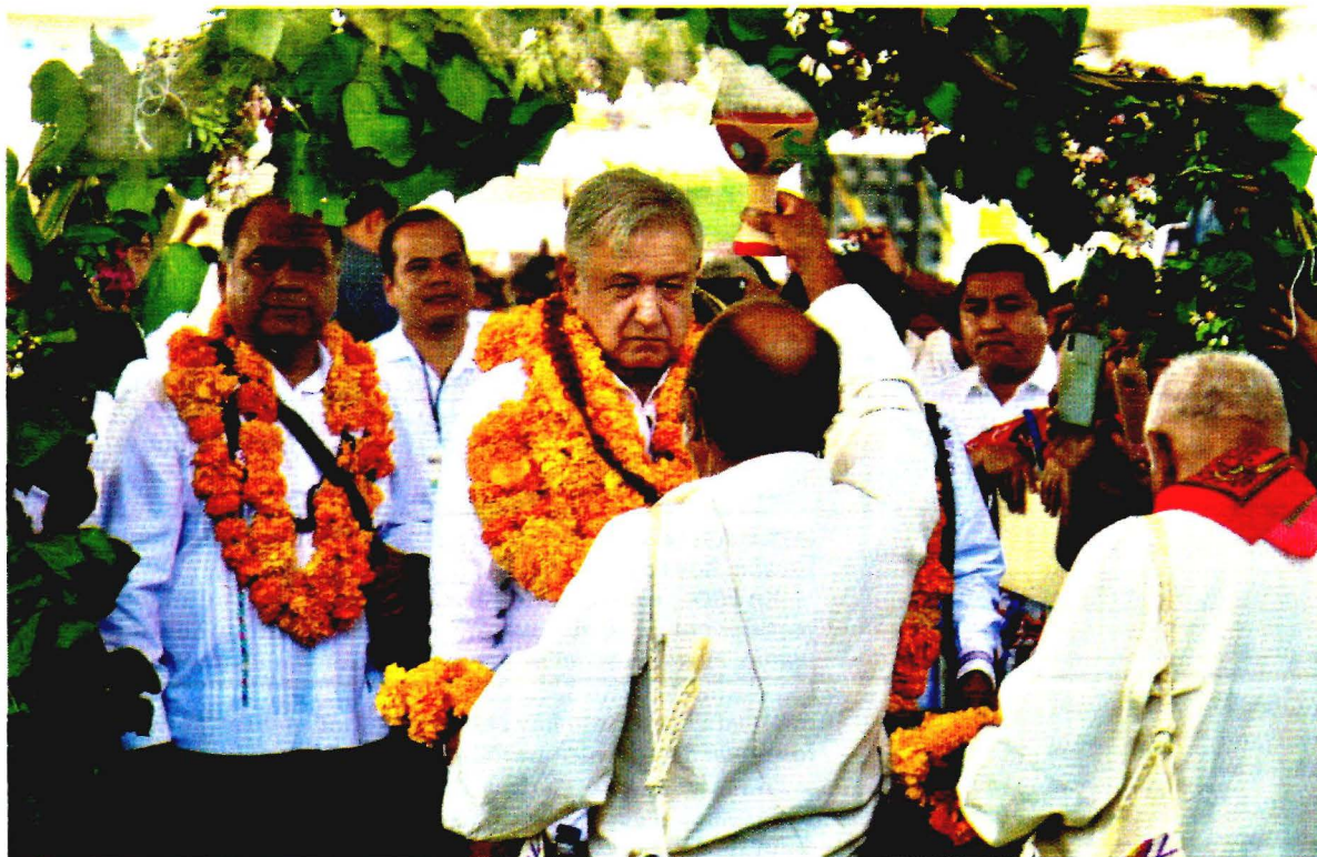
EL PRESIDENTE, ayer, en Tlapa, Guerrero; atrás (izq.), el gobernador Héctor Astudillo.

AMLO afirma que como Comandante Supremo de las FA no permitirá ninguna injusticia y se llegará a la verdad. pág. 6