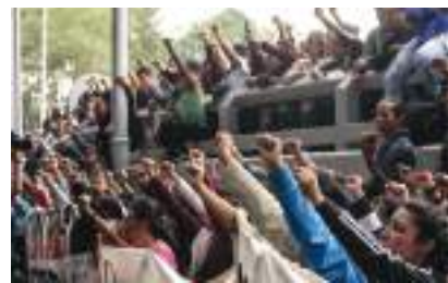
PADRES de los 43, ayer en la FGR.