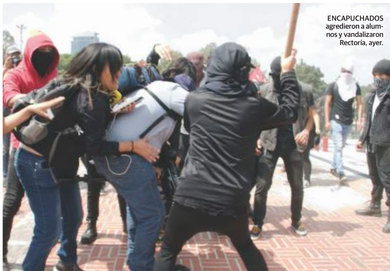
ENCAPUCHADOS agredieron a alumnos y vandalizaron Rectoría, ayer.

Rompen, pintan y prenden fuego; "burda provocación": UNAM pág. 13