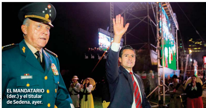
EL MANDATARIO (der.) y el titular de Sedena, ayer.

» El jefe delegacional en Cuauhtémoc afirma que subordinará sus aspiraciones legítimas a los intereses del partido político que encabeza Andrés Manuel López Obrador; el zacatecano avizora que el de 2018 será un proceso "álgido, polarizado y competido" pág. 8