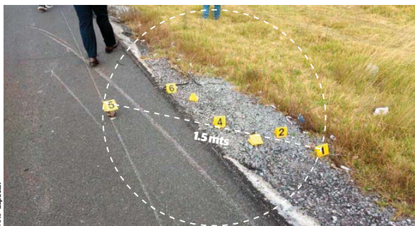
Reconstrucción de los hechos en los que se localizaron siete cartuchos.

Ningún casquillo es de los ladrones. Peritos rastrearán un área de 100 metros sin encontrar evidencias.