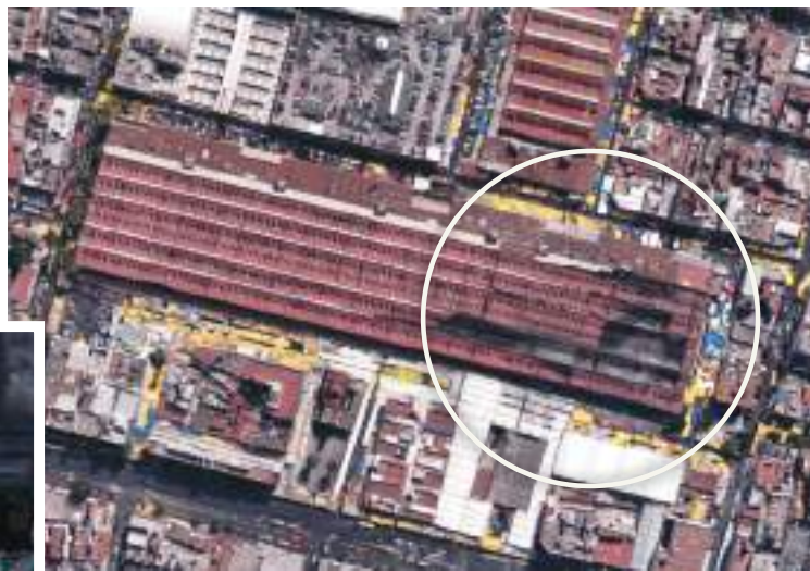
VISTA aérea de la zona siniestrada del mercado.