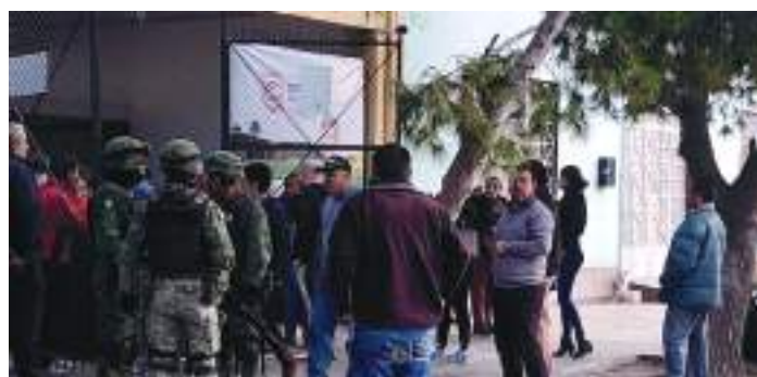
RESGUARDO del Colegio Cervantes, en Torreón, ayer.

LA ESCUELA expresa el sentir del país tras el hecho; descalifican a góber por revelar nombre del alumno y cargar culpa a videojuego pág. 7