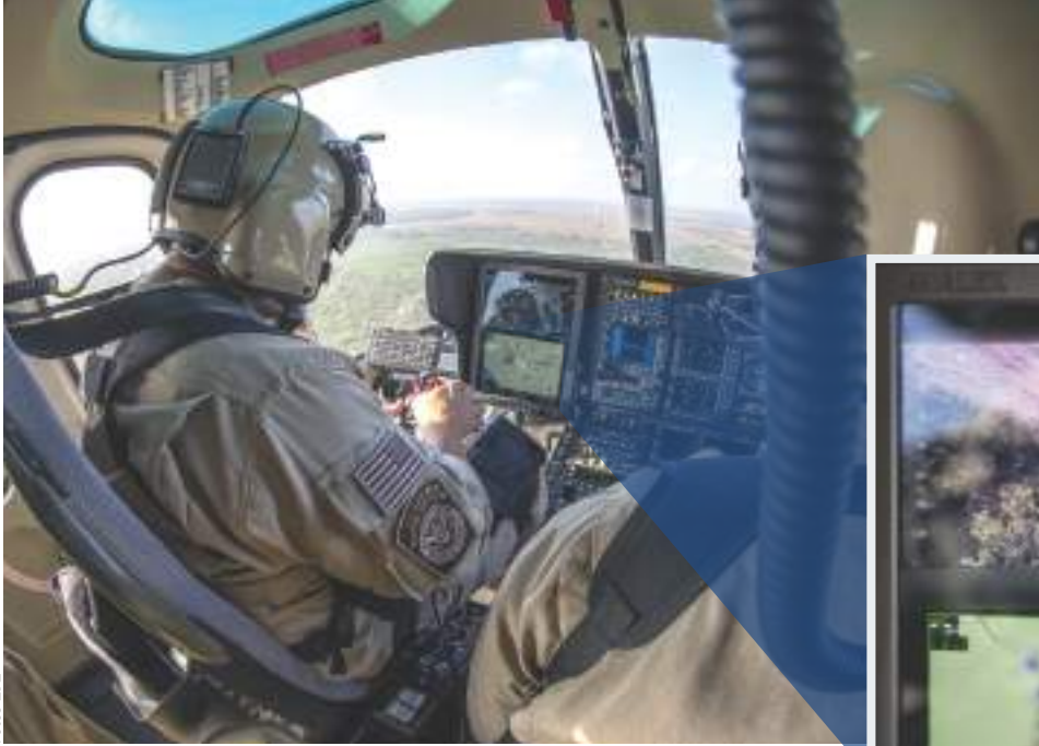
CON CÁMARAS, elementos de la border patrol siguen los flujos de migrantes en Texas.