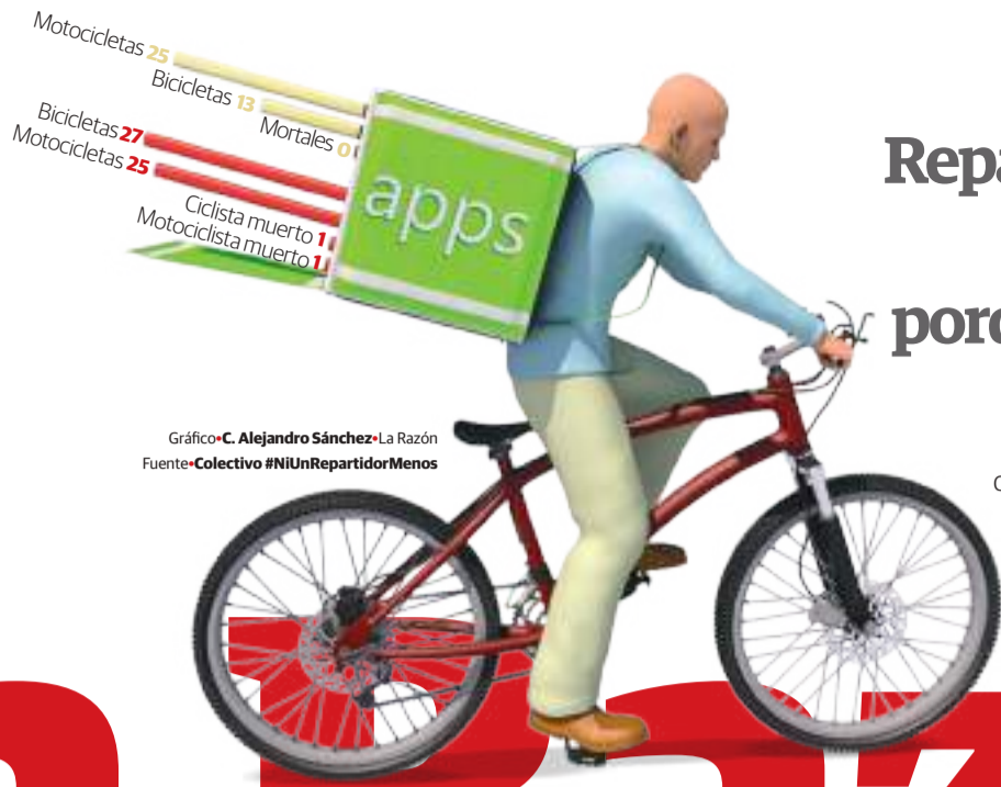
Gráfico: C. Alejandro Sánchez • La Razón Fuente: Colectivo #NiUnRepartidorMenos