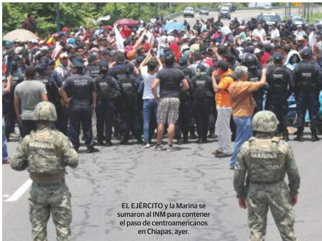
EL EJÉRCITO y la Marina se sumaron al INM para contener el paso de centroamericanos en Chiapas, ayer.

CANCILLER Ebrard señala que ambos países coinciden en que la situación migratoria actual no puede continuar; optimista, hoy reanuda diálogo págs. 3 y 4