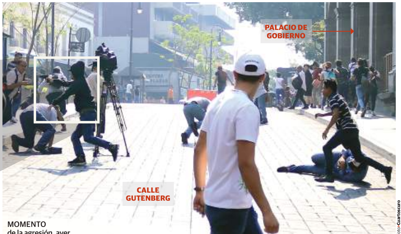
MOMENTO de la agresión, ayer.

SE CULPAN del hecho entre sindicatos; el mandatario estatal y el alcalde piden Guardia Nacional; homicidios crecen 27% en actual gobierno