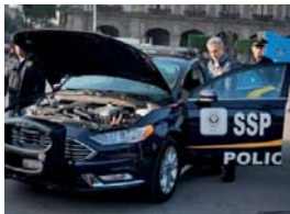
MANCERA presentó las primeras 100 patrullas híbridas para la CDMX, ayer.