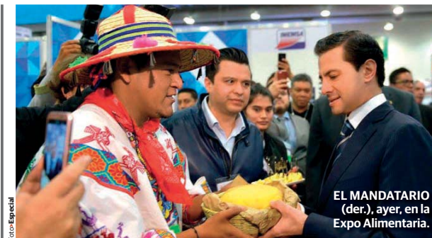
EL MANDATARIO (der.), ayer, en la Expo Alimentaria.

"Estoy decidido a respaldar y a dar mi modesta aportación al movimiento que encabeza Andrés Manuel la posibilidad del triunfo electoral... éste es el momento de ayudar sin que haya ninguna condición"