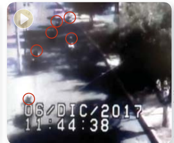
Y EL ESCAPE del resto de la banda, por San Juan de Aragón, en la Gustavo A. Madero.