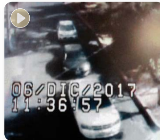
TAMBIÉN el Avenger donde viajaban cuatro de los que mataron a los custodios.