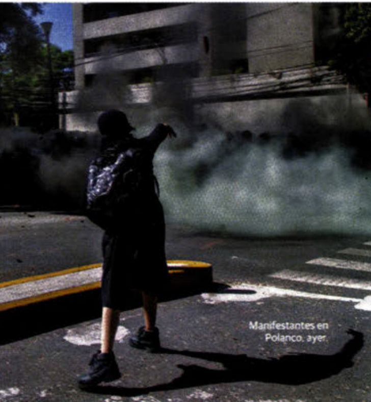
Manifestantes en Polanco, ayer.