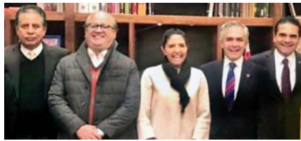
JESÚS ORTEGA, Graco Ramírez, Alejandra Barrales, Miguel Mancera y Silvano Aureoles, ayer.