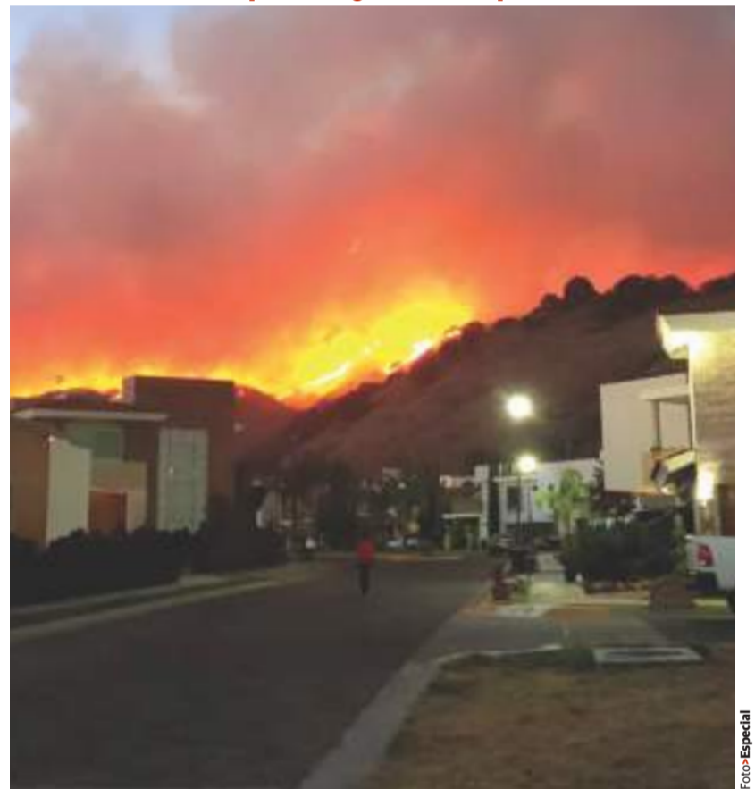
AUTORIDADES de Jalisco combaten el incendio con 4 aeronaves; el humo afectó, ayer, a Tlajomulco, Zapopan, Guadalajara y Tlaquepaque. pág. 10