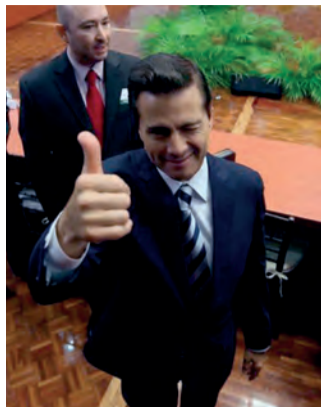
EL MANDATARIO, ayer.

Destaca que presencia del equipo de transición en negociación "genera certidumbre en lo doméstico".