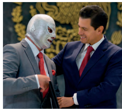
EL PRESIDENTE, ayer, con el Hijo del Santo, durante el reconocimiento del mérito deportivo.

El mandatario pide trabajar para que se convierta en un hábito en la sociedad; destaca que esta actividad reforzará valores y disciplina; al entregar distinciones a atletas por sus logros, dice que, al igual que en el deporte hay avances, pero se deben reconocer políticas que no han sido del todo acertadas; admitir fallas es parte del aprendizaje, afirma. págs. 3 y 14