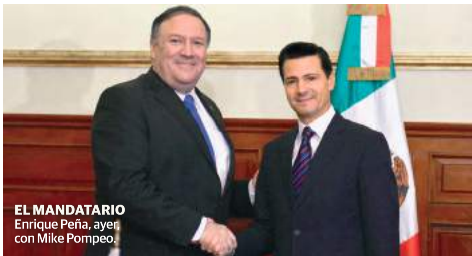
EL MANDATARIO Enrique Peña, ayer con Mike Pompeo.