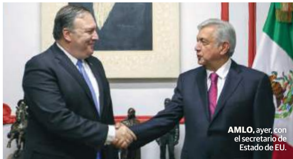
AMLO , ayer, con el secretario de Estado de EU.