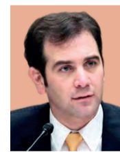
Lorenzo Córdova Consejero presidente del INE

ASEGURA que están preparados para cualquier escenario el 1 de julio; reitera que los ciudadanos son los que decidirán a quién dan su voto pág. 3