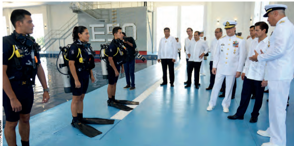
EL MANDATARIO (centro derecha), ayer, en la escuela naval, en Veracruz.

» López Obrador anuncia 2 iniciativas: una, para tipificar como delitos graves la corrupción, fraude electoral y robo de hidrocarburos; la otra, "para buscar el bienestar de los mexicanos" pág. 5