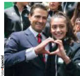
EL MANDATARIO, ayer, con deportistas que irán a los Juegos Centroamericanos.

EPN: sociedad acreditó su vitalidad democrática