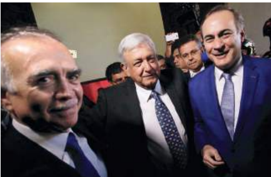
ALFONSO ROMO, Andrés Manuel López Obrador y Juan Pablo Castañón, ayer.

EL LÍDER del blanquiazul, Damián Zepeda, señala que miles de defensores participarán en conteos a favor de sus candidatos; harán valer la voluntad ciudadana, dice