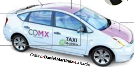
Gráfico: Daniel Martínez - La Razón

Los taxímetros serán reemplazados por una tableta que no podrá ser alterada.