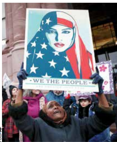
UNA MUJER protesta contra las medidas de Trump, en Cincinnati, ayer.

» Trump insiste en el veto migratorio y despide a fiscal que se negó a acatar su decreto págs. 18 y 19