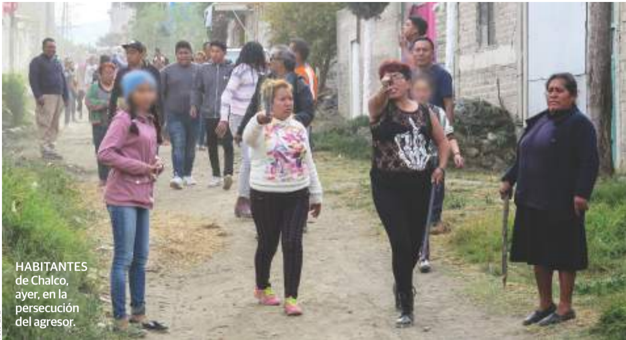
HABITANTES de Chalco, ayer, en la persecución del agresor.