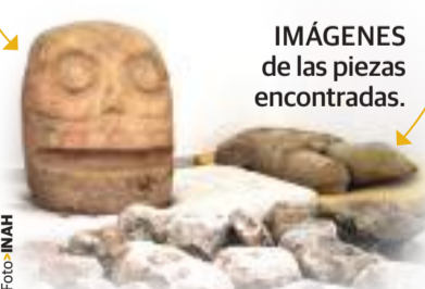
IMÁGENES de las piezas encontradas.

CRÁNEO 70 centímetros Altura 80 centímetros Material Piedra volcánica TORSO Piedra volcánica