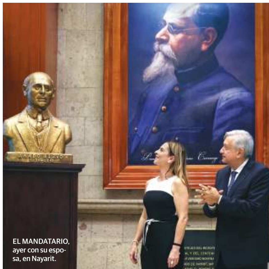
EL MANDATARIO, ayer con su esposa, en Nayarit.