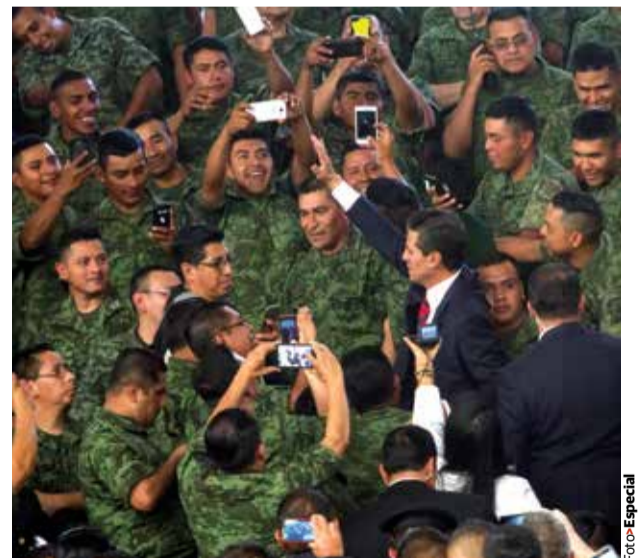
EL MANDATARIO se reunió con integrantes del Ejército y de la Marina, ayer.

“Pregúntale al Ejército, no seas provocador”