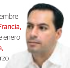
EL GOBERNADOR de Yucatán.