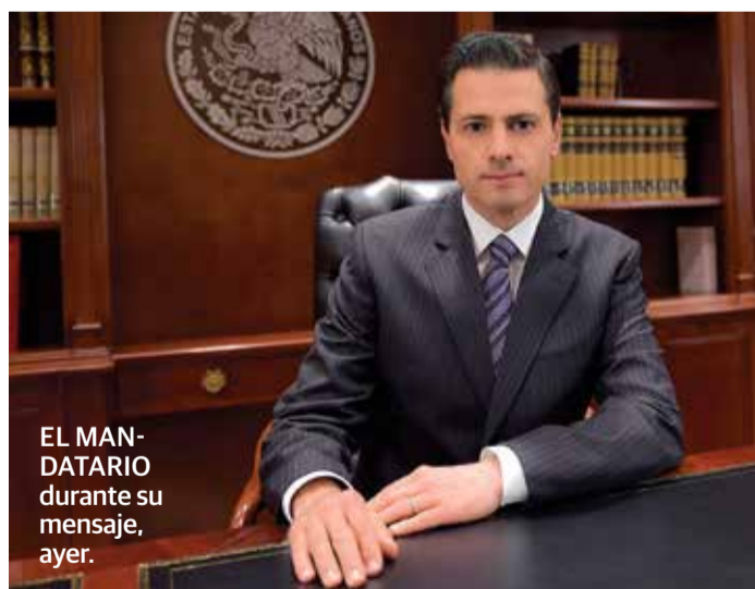
EL MANDATARIO durante su mensaje, ayer.

EN MENSAJE asume la responsabilidad de proteger los intereses del país; llama a la unidad a legisladores y a la sociedad pág. 4