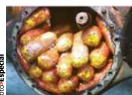
LA DROGA incautada envuelta en cinta canela.

EL CARGAMENTO de 25 kilogramos de droga fue decomisado en Nayarit; era de los Beltrán Leyva. pág. 12