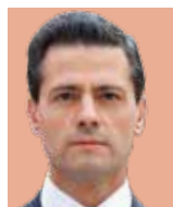
Enrique Peña Nieto Presidente de México

EL PRESIDENTE asegura que el encuentro debe fortalecer el diálogo; reconoce voluntad del gobierno estadounidense pág. 4