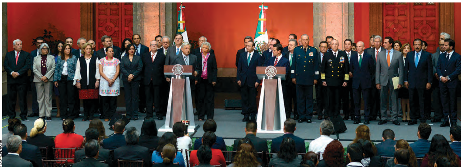
LOS PRESIDENTES electo, AMLO, y actual, Enrique Peña, ayer, con sus respectivos gabinetes, en el inicio de la transición.