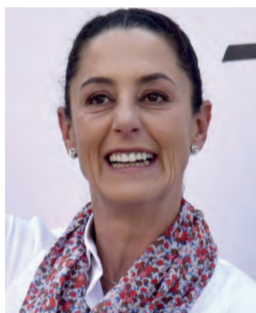
CLAUDIA SHEINBAUM ARROGANTE FIRME