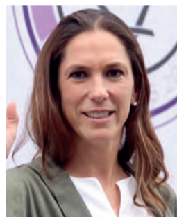
MARIANA BOY PROPOSITIVA MONÓTONA