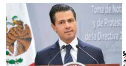
EL MANDATARIO, ayer.