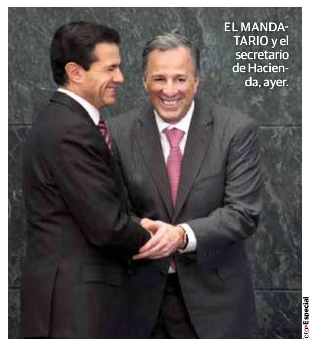
EL MANDATARIO y el secretario de Hacienda, ayer.