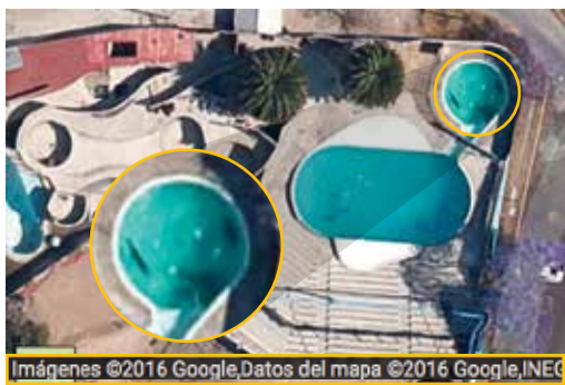
IMAGEN de Google en la que se aprecian los animales (círculo).

EL PARQUE dejó de operar hace 4 años; un encargado dijo a La Razon que en 2015 harían remodelaciones, "pero hoy todo está parado y sólo mantene-mos a dos animales"