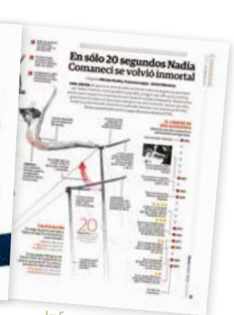
Infografía de Nadia Comaneci.