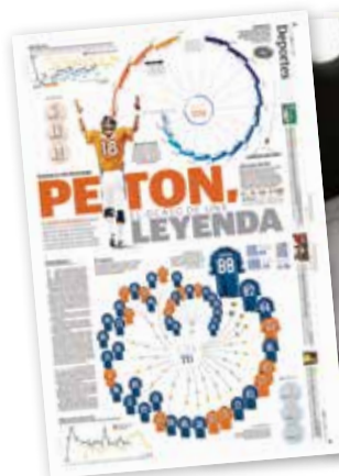
Infografía sobre Peyton Manning.

El periódico es uno de los 8 finalistas a Mejor Diario Nacional de 120 publicaciones de 15 países.