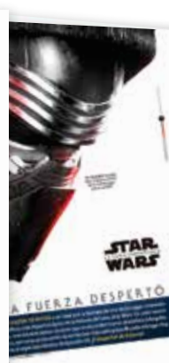
Especial de Star Wars.