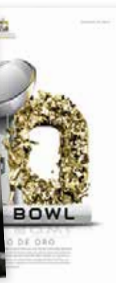
Cobertura del Super Bowl.