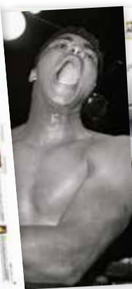
Muerte de Mohamed Alí.