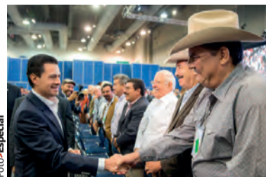
EL MANDATARIO, ayer, en la inauguración de México Alimentaria 2018 Food Show.

» El Presidente destaca que se generan 30 millones más que en 2012; prevé que exportaciones superen 35 mil millones de dólares al final de su administración pág. 10