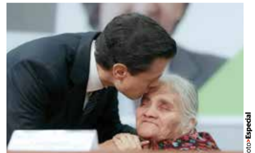
EL MANDATARIO con una artesana, en la entrega del Premio Nacional de Ciencias y Artes, ayer.

» El Presidente Enrique Peña destaca que aumentó a 370 mil mdp; afirma que seguirá impulsando el desarrollo de ese rubro, de la educación y las artes; en 2017 destinarán 100 mmdp adicionales, dice pág. 10