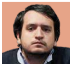
Andrés López Beltrán Desde septiembre se hace cargo en la CDMX.