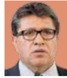
Ricardo Monreal Jefe delegacional en Cuauhtémoc

DESPLAZARÍA a Corea del Sur, prevén expertos; aun con una salida de EU del TLCAN, nuestro país mantendría la competitividad, pues se pasaría de aranceles tasa cero a apenas un impuesto de 0.1%, aseguran. pág. 20