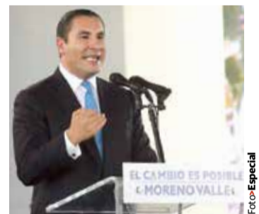
RAFAEL MORENO Valle, ayer.

EL GOBERNADOR advierte sobre populismos y señala que para remontar dificultades se necesita unidad; al presentar su sexto Informe destaca que la entidad logró cifra récord de 5 mmdd en Inversión Extranjera Directa. pág. 11