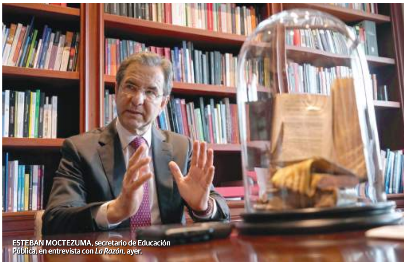
ESTEBAN MOCTEZUMA, secretario de Educación Pública, en entrevista con La Razón , ayer.

La fracción 7 del artículo tercero va a quedar intacta. El tema de que las universidades tengan un mejor manejo económico, velen más por el aprendizaje de sus alumnos es algo totalmente ajeno a la discusión del tema”