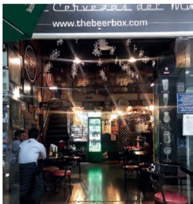
THE BEER BOX, San Jerónimo.