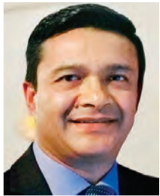
Marco Aurelio Edad: Tenía 44 años