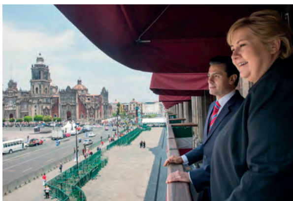
EL MANDATARIO, ayer, con la Primera Ministra de Noruega, Erna Solberg, en los balcones de Palacio Nacional.

» El Presidente Enrique Peña recibe en visita de Estado a la Primera Ministra Erna Solberg; advierten que el proteccionismo y las barreras comerciales pueden revertir los beneficios de la globalización pág. 9