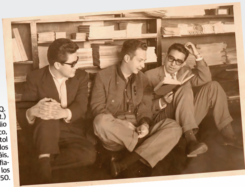
(DE IZQ. A DER.) José Emilio Pacheco, Sergio Pitol y Carlos Monsiváis, fotografiados en los años 50.