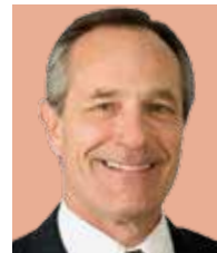
Alan Bersin Analista político de EU

Alan Bersin , experto en migración, asegura a La Razón que el número de indocumentados procedentes de México se ha reducido en un 80%, el muro de Trump es inútil y costoso; reconoce esfuerzo de nuestro país en control. pág. 6