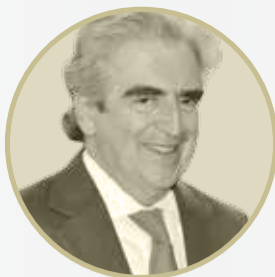
RAFAEL TOVAR Y DE TERESA 1954-2016

ADOS DÍAS de su muerte, la obra de Rafael Tovar y de Teresa ya empieza a ser equiparada con la de José Vasconcelos, como constructor de instituciones culturales; diplomático, novelista, creador del Conaculta, del Cenart y de la Secretaría de Cultura, hombre culto y refinado, deja un hueco para el Estado difícil de llenar. págs. 32 y 33