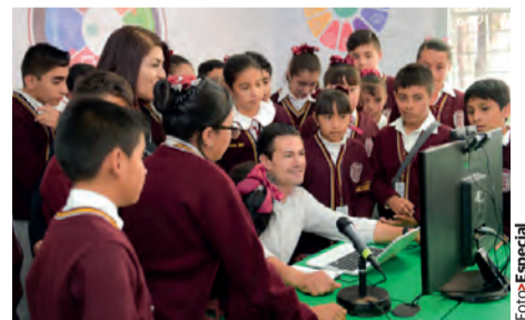
EL EJECUTIVO, ayer, en Tepetzotlán.

» El mandatario afirma que la sociedad mexicana está convocada a actuar con decisión y solidaridad por la educación de los niños; arduo y difícil, impulso al proyecto para mejorar maestros, señala pág. 9