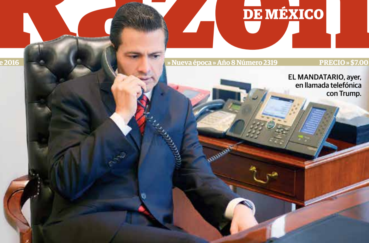
EL MANDATARIO, ayer, en llamada telefónica con Trump.

» El Presidente indicó que en la agenda con el próximo mandatario de EU su prioridad será proteger a México y a los mexicanos; asegura que en la relación entre ambas naciones lo más importante es la unidad; "emplearemos nuestra creatividad, el esfuerzo y el talento de nuestra gente para abrir nuevos caminos", afirmó pág. 7